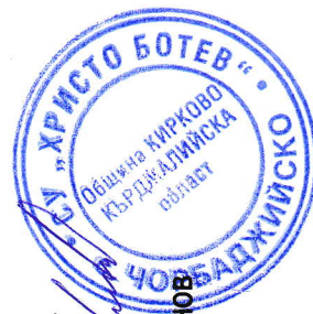
СТЕФАН РАДИОНОВ ДИРЕКТОР

Заповедта да се връчи на лицата срещу подпис за сведение и изпълнение.